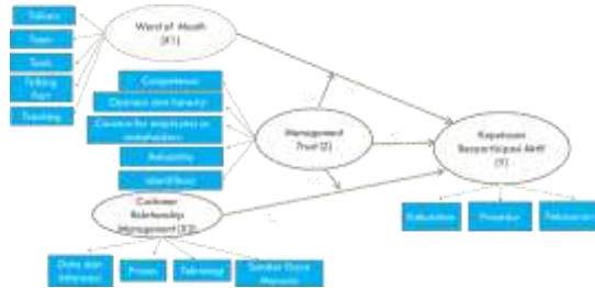
Gambar 1. konstruk Penelitian

relationship management , keputusan anggota berpartisipasi aktif, dan management trust . PLS-SEM akan digunakan untuk menguji model yang terbentuk dari variable-variabel tersebut sehingga nantinya dapat digunakan dalam memprediksi variabel yang mempengaruhi keputusan anggota berpartisipasi aktif.