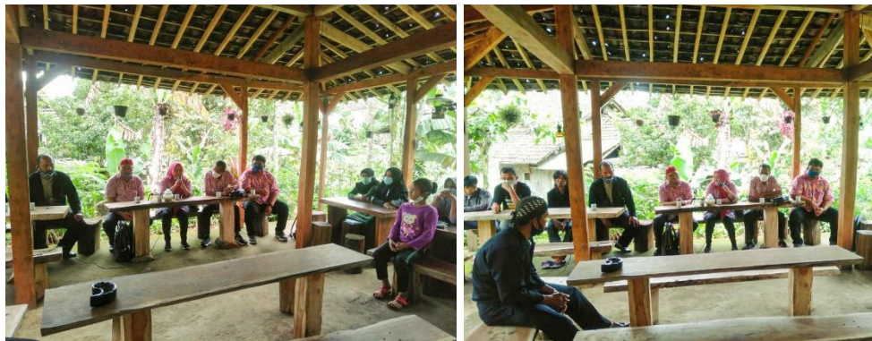
Gambar 2. Perkenalan dibalai desa dan Tim Pengabdi dari memberi pengerahan oleh kepala desa

Kegiatan pengabdian kepada masyarakat UMKM di Dusun Segunung Kecamatan Wonosalam Kabupaten Jombang ini berjalan lancar hingga masa pendampingan berakhir. Para pramusaji tidak menemui kendala berarti saat menyiapkan modul digital marketing, membagikan surat undangan, serta peminjaman dan penyiapan lokasi. Modul mencakup berbagai topik, termasuk pengenalan pemasaran digital, sosialisasi Undang-Undang Informasi dan Transaksi Elektronik tahun 2008, alasan memilih pemasaran digital, persiapan penggunaan media dalam pemasaran digital, dan pembuatan akun di berbagai media sosial dan e-commerce situs.