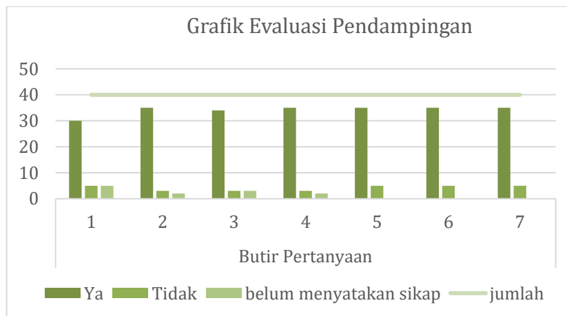
Gambar 1. Grafik Kegiatan Pendampingan

Grafik di atas menunjukkan bahwa sebagian besar peserta pendampingan mampu menerima dan memahami materi Digital Marketing. 1) Jumlah peserta yang memahami materi digital marketing yang disampaikan adalah 30 orang; 2) Jumlah peserta yang memahami pemanfaatan digital marketing sebagai sarana pemasaran produk UMKM sebanyak 35 orang; 3) Jumlah peserta yang memahami isi materi adalah 34; 4) Jumlah peserta yang memahami materi yang disampaikan adalah 35; dan 5) Jumlah peserta yang memahami diskusi adalah 35 orang, jenis produk UMKM yang mengikuti dapat dilihat pada tabel 2 berikut: