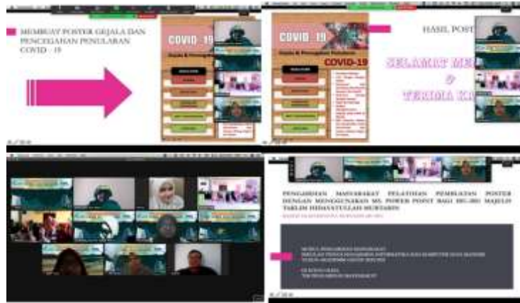
Gambar 3. Pelaksanaan PM

Berikut proses pelaksanaan Pengabdian Masyarakat secara daring