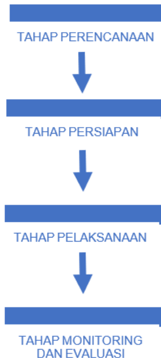
Gambar 2. Tahapan pelaksanaan pengabdian masyarakat

Komputer Nusa Mandiri, yang nantinya akan menghasilkan sebuah produk berupa poster atau brosur sesuai kebutuhan akan kegiatan yang akan dilaksanakan baik kegiatan Majelis maupun kegiatan pribadi. Target peserta dari pengabdian masyarakat ini yaitu sebanyak 20 peserta Ibu-Ibu dari Majelis Taklim Hidayatullah Mutabdiin. Metode pelaksanaan yang digunakan dalam pengabdian masyarakat pada ibu-ibu Majelis Taklim Hidayatullah Mutabdiin yaitu: