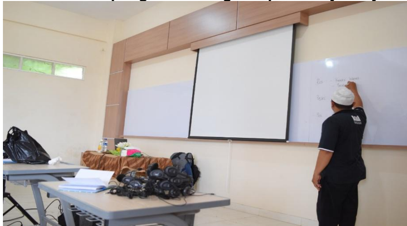
Gambar 2 Pemateri memberi pengantar mengenai pembelajaran jarak jauh

Produk yang dihasilkan dalam kegiatan ini berupa pengetahuan kepada guru-guru dan musyrif di Islamic Boarding School Al Hamra Malang mengenai pembelajaran jarak jauh. Ketika para peserta melakukan praktek, para pemateri mendampingi peserta dalam pelaksanaannya. Hampir secara keseluruhan para peserta tidak mengalami kesulitan dalam mempraktekkan materi yang sudah disampaikan sebelumnya. Beberapa peserta yang masih kesulitan, langsung diajarkan oleh pemateri supaya tidak kesulitan lagi. Untuk selanjutnya, para guru dan musyrif akan langsung mempraktekkan hasil seminar dan workshop ke peserta didik mereka masing-masing. Untuk proses pelaksanaan pengabdian bisa dilihat pada Gambar 2 – Gambar 6 berikut.