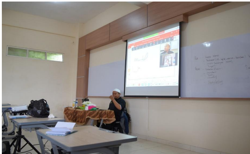
Gambar 4 Pemateri menyampaikan materi