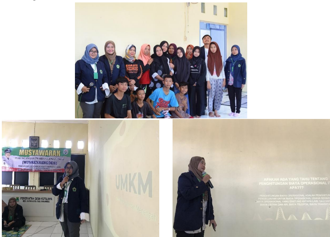
Gambar 2. Sosialisasi Pentingnya Pemahaman Standar Akuntansi dalam Pembuatan Laporan Keuangan UMKM dan Simulasi

Setelah kegiatan simulasi selesai dilaksanakan, para audiens juga diberikan pembelajaran mengenai cara membuat proposal pendanaan. Pada kegiatan ini, para pelaku UMKM diajarkan bagaimana membuat proposal pendanaan yang baik dan benar untuk meningkatkan kemampuan permodalan usahanya. Mereka juga diajarkan mengenai kelengkapan dokumen dan persyaratan yang dibutuhkan dalam mengajukan pendanaan melalui Program Kredit Usaha Rakyat (KUR) dari Bank BRI. Tujuan dari kegiatan ini adalah untuk membantu masyarakat dalam mengajukan pendanaan dan memperoleh sumber pembiayaan yang dibutuhkan untuk pengembangan bisnis UMKM mereka.