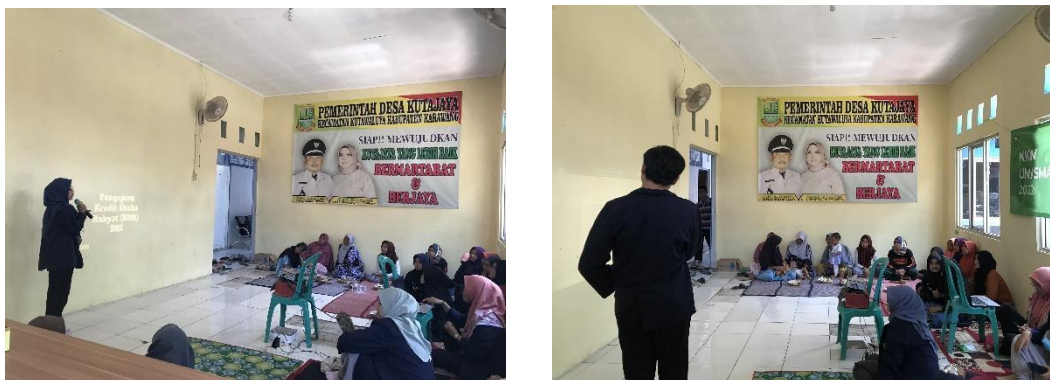
Gambar 3. Proposal Pengajuan Bantuan Pendanaan UMKM

Setelah pelatihan selesai, kami memberikan kesempatan kepada audiens untuk berdiskusi dan bertanya seputar materi pelatihan yang telah disampaikan. Melalui diskusi tersebut, audiens mendapatkan pemahaman yang lebih mendalam tentang cara menyusun proposal pendanaan yang baik dan benar, serta berbagai strategi untuk memperoleh pendanaan UMKM yang lebih baik di masa depan.