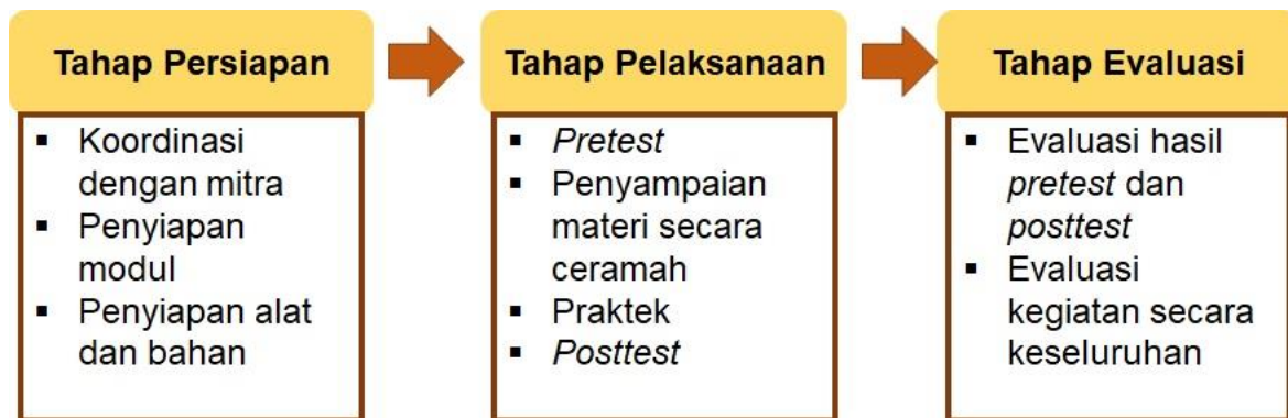
Gambar 1. Metode Pelaksanaan Kegiatan

Tahap evaluasi adalah tahap akhir dalam kegiatan pengabdian masyarakat yang penting untuk mengevaluasi kesuksesan kegiatan. Evaluasi dilakukan dengan melihat hasil pretest dan posttest yang diperoleh serta mengevaluasi kegiatan secara keseluruhan. Dari hasil evaluasi, diharapkan dapat diperoleh umpan balik yang dapat digunakan untuk meningkatkan kualitas kegiatan pengabdian masyarakat di masa yang akan datang.