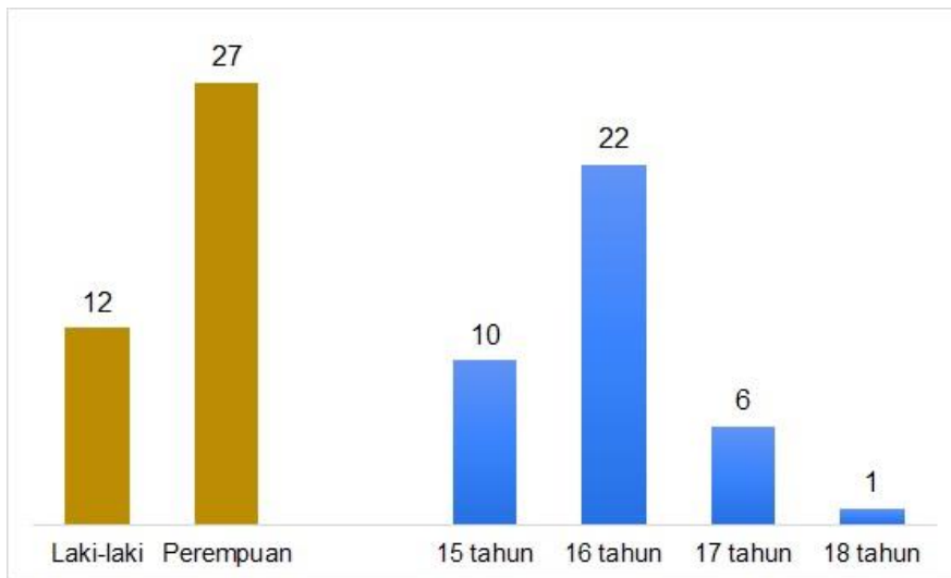
Gambar 2. Distribusi Peserta Berdasarkan Jenis Kelamin Dan Usia

dengan total jumlah peserta 39 orang. Adapun 4 sekolah yang terlibat adalah SMAN 1 Glagah, SMAN 1 Giri, SMAN 1 Banyuwangi dan SMAK Hikmah Mandala. Selain itu kegiatan juga dihadiri oleh guru pendamping dari masing-masing sekolah. Distribusi peserta kegiatan berdasarkan usia dan jenis kelamin dapat dilihat pada Gambar 2, yaitu terdiri dari 12 orang laki-laki dan 27 orang perempuan, dengan rentang usia 15 – 18 tahun, dan terbanyak pada usia 16 tahun.