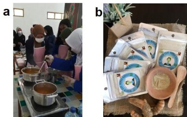
Gambar 3. Peserta Praktek Membuat Jamu Kunyit Asam (A), Hasil Produk Masker Wajah

Pada pelatihan ini peserta mendapatkan 2 materi yang diberikan melalui metode ceramah dengan topik 1) cara membuat jamu yang baik dan benar, serta 2) cerdas memilih obat tradisional yang aman. Selain itu peserta juga belajar membuat jamu kunyit asam dan masker wajah yang hasilnya dapat dilihat pada Gambar 3.