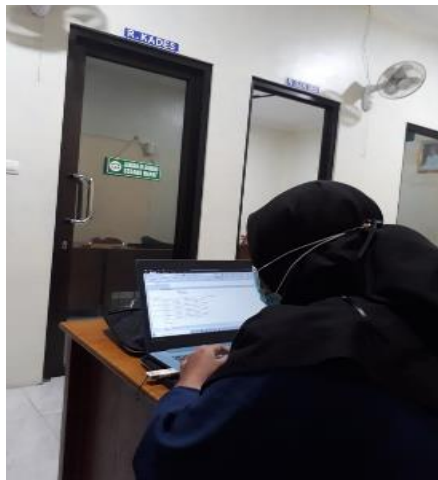
Gambar 4. Perpisahan KKN Desa Parangjoro Bersama Kepala Desa