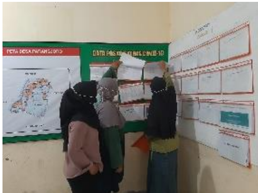
Gambar 2. Sosialisasi Administrasi Posko Covid-19 Desa Parangjoro

Dengan adanya kesadaran masyarakat mengenai pencegahan terpaparnya virus Covid-19 membuat perubahan yang terjadi dimasyarakat dengan melakukan gerakan 5 M yaitu Memakai masker, Mencuci tangan dengan sabun dan air mengalir, Menjaga jarak, Menjauhi kerumunan, serta Membatasi mobilisasi dan interaksi.